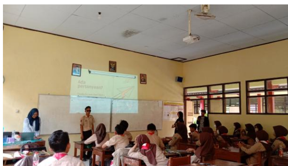
Gambar 5: Salah Satu Audience Menjawab Pertanyaan dalam Sosialisasi Pengenalan Dunia Kampus