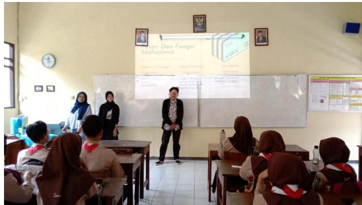
Gambar 2: Pemateri 2

Sebagai generasi penerus, mahasiswa diharapkan dapat menjaga stabilitas moral di lingkungan masyarakat. Mahasiswa diharapkan mampu untuk mencerminkan nilai serta karakter terbaik, sesuai dengan tingkatan intelektual yang ia miliki dan telah diperoleh di perguruan tinggi. 6