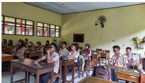
Gambar 4: Audience Sosialisasi Pengenalan Dunia Kampus

Universitas Gadjah Mada, Universitas Indonesia, Universitas Negeri Semarang, dan Perguruan Tinggi favorit lainnya. Siswa-siswi SMA Negeri 1 Kajen juga mendapatkan informasi tentang bagaimana dunia perkuliahan itu, istilah-istilah apa saja yang ada di kampus, antropologi kampus yang meliputi tipologi mahasiswa, peran serta fungsi mahasiswa bagi generasi yang akan datang. Kegiatan sosialisasi terlaksana baik dan lancar tanpa suatu halangan apapun, dan audience juga tampak menikmati kegiatan ini, karena diselingi dengan canda tawa agar mereka tidak bosan. Sehingga rasa puas dirasakan oleh seluruh pihak, khususnya para siswa-siswi karena mereka mendapatkan informasi yang mereka butuhkan. Presentase dari kelangsungan kegiatan ini adalah 80% dilihat dari antusias seluruh peserta dan kelancaran jalannya sosialisasi.