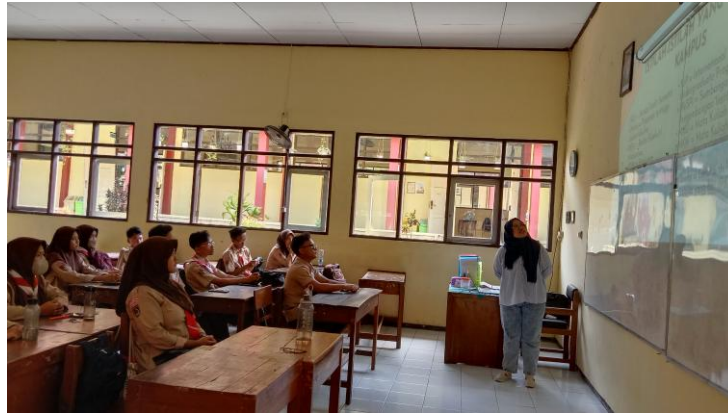
Gambar 1. Pemateri 1

Yaitu ekstrakurikuler yang ada di perguruan tinggi. Contohnya: UKM Pencak Silat, UKM Musik, UKM Teater, dll. 4